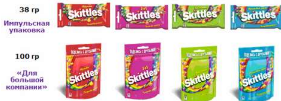
Рис. 2. Портфель жевательных конфет Skittles в России

У бренда Skittles есть свои отличительные характеристики: Целевая аудитория – подростки и молодые люди 14–25 лет. Позиционирование – Skittles открывает мир с необычной стороны, показывает, что в обычной реальности могут существовать самые непредсказуемые вещи. Девиз бренда – «Со Skittles всегда ожидай самого неожиданного!». Skittles является лидером по поддержке на ТВ в категории кондитерских изделий и обладает самой высокой узнаваемостью среди конкурентов. Это один из самых популярных брендов среди молодежи не только во всем мире, но и в России, его группа в социальной сети «ВКонтакте» насчитывает более 700 тыс. подписчиков.