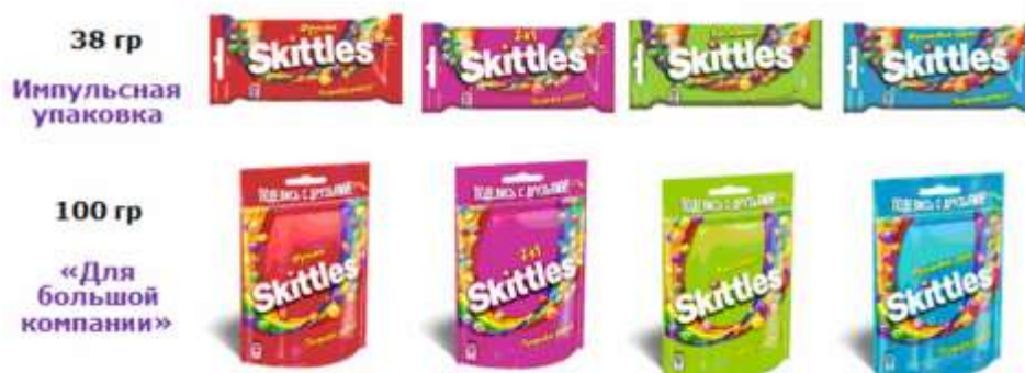
Рис. 2. Портфель жевательных конфет Skittles в России

Из рисунка 1 видно, что даже торговые марки, занимающие лидирующие позиции в сегменте, достигают не более 16% доли рынка, а более 51% приходится на небольшие бренды локальных производителей. Жевательные конфеты Skittles появились в России в 2002 году. Они не имеют аналогов на рынке, так как обладают уникальной технологией производства, которую очень сложно повторить. В пачке 5 разных фруктовых вкусов, каждая конфета имеет мягкий центр и твердую глазурь, брендированную буквой «s». Сегодня портфель марки представлен двумя форматами и продается в четырех вкусах (рис. 2):