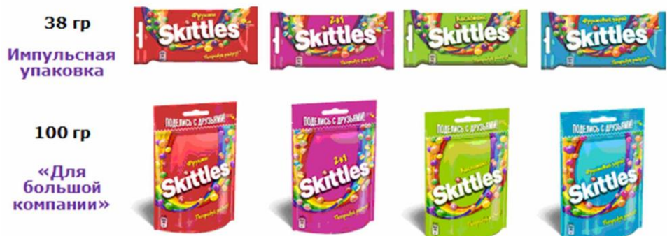
Рис. 2. Портфель жевательных конфет Skittles в России

У бренда Skittles есть свои отличительные характеристики: Целевая аудитория – подростки и молодые люди 14–25 лет. Позиционирование – Skittles открывает мир с необычной стороны, показывает, что в обычной реальности могут существовать самые непредсказуемые вещи. Девиз бренда – «Со Skittles всегда ожидай самого неожиданного!». Skittles является лидером по поддержке на ТВ в категории кондитерских изделий и обладает самой высокой узнаваемостью среди конкурентов. Это один из самых популярных брендов среди молодежи не только во всем мире, но и в России, его группа в социальной сети «ВКонтакте» насчитывает более 700 тыс. подписчиков.